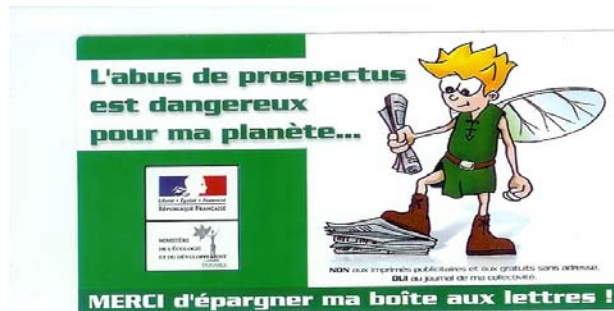
La Pub vous agace ? Collez cette vignette sur votre boîte aux lettres (la demander à la Mairie)