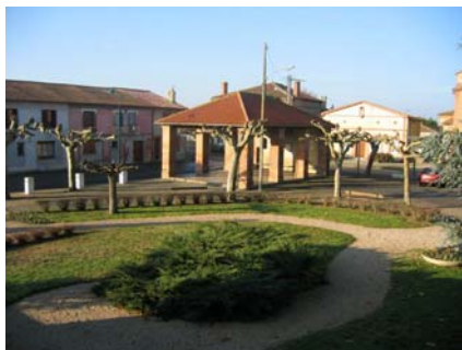
La Halle un matin d'hiver